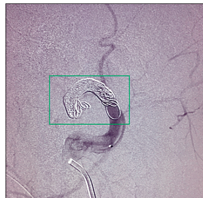
Figura 3. Angiografía por sustracción digital 3 meses después de procedimiento. Recuadro verde: canasta de Coils organizada, con oclusión satisfactoria de fístula arteriovenosa con permeabilidad de vasos sanos.